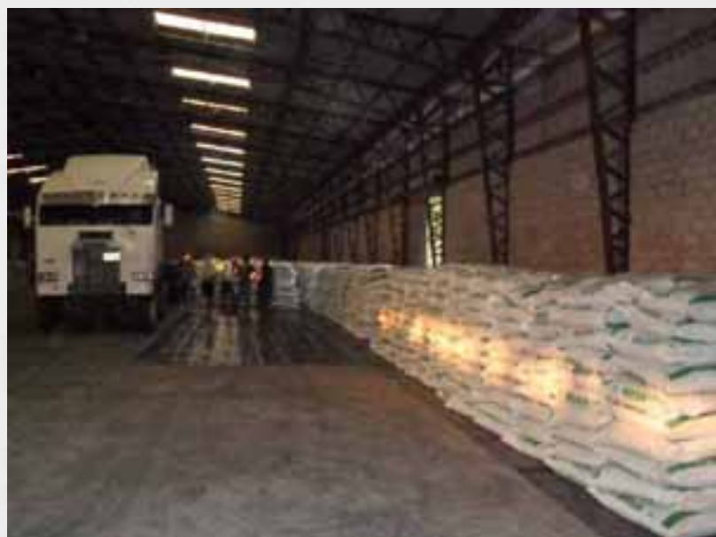
Compras de maíz y fertilizante puestos en bodega, luego de un proceso competitivo y transparente.

Este nuevo acuerdo contribuyó a la transparencia y agilidad de las adquisiciones y contrataciones de servicios gubernamentales; así como al fortalecimiento del MAG y las entidades agrícolas públicas mediante la experiencia hemisférica de IICA. Las acciones implicaron la adquisición y puesta en bodegas de 650 mil bolsas de maíz y de fertilizantes, bajo un proceso rápido, innovador, dinámico e intachable luego de un proceso de compras competitivo y transparente.