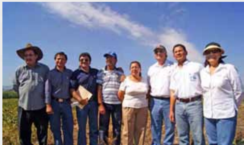
Actores del sector agrícola salvadoreño trabajan coordinadamente para el Plan de Agricultura Familiar (PAF).

Es evidente que existe una proliferación de iniciativas en el ámbito de la cooperación internacional agrícola, lo que genera una atomización de esfuerzos y hace necesario que las instituciones cuenten con mecanismos efectivos de rendición de cuentas y evaluación de impactos.