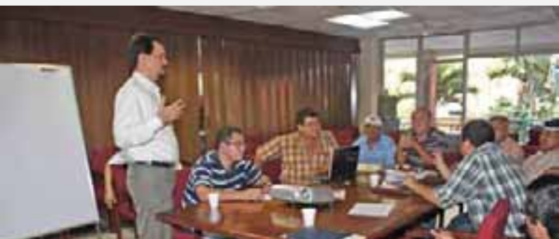
Personal del Ministerio de Agricultura y Ganadería en sesión de planificación estratégica y operativa con asesoría técnica del IICA.

La oficina colaboró con las autoridades del país, especialmente con el Ministerio de Agricultura y Ganadería en el diseño e implementación del Plan de Agricultura Familiar (PAF), el cual fue lanzado por el Presidente de la República el 21 de febrero de 2011, en Tecoluca, San Vicente, con una inversión hacia el sector de recursos públicos sin precedentes. Esta nueva política demandó un ejercicio de planificación muy cercano e interactivo con los funcionarios del MAG, implicó repensar las intervenciones tecnológicas agrícolas previas y retomar lo mejor de las experiencias y metodologías más significativas y recientes puestas en práctica en el agro salvadoreño.