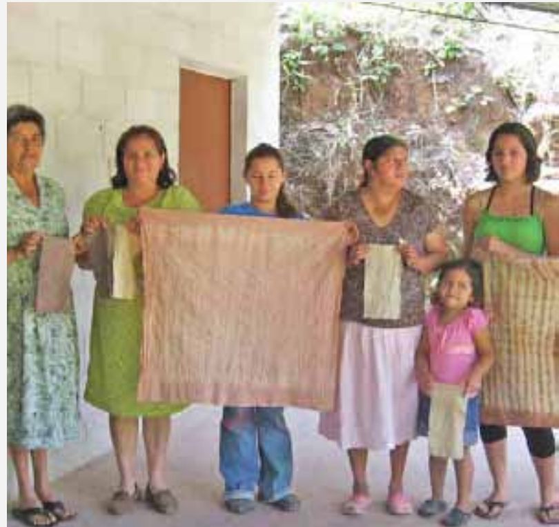
Taller de colorantes naturales en Suchitoto con la interacción JICA-IICA.

En materia de investigación, la especialista japonesa responsable de conducir el taller