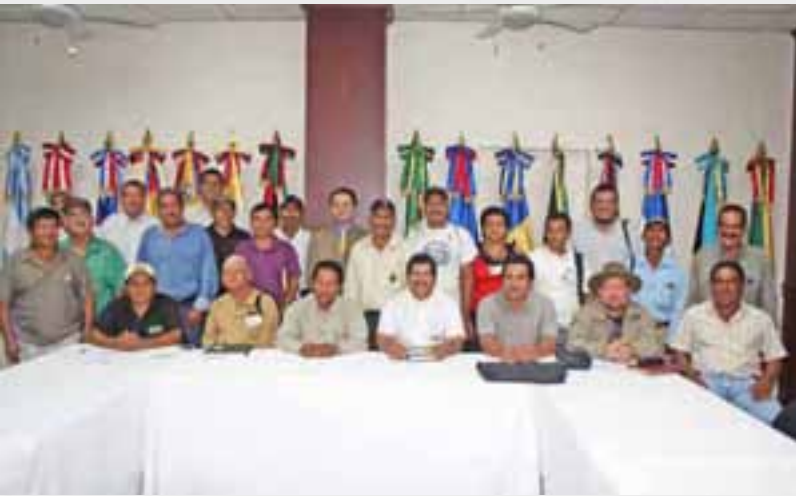
Capacitación sobre Enfoque de Cadenas Agroproductivas para agricultores de maíz.

de comercialización para productores de maíz, en el marco del proyecto Red SICTA del IICA / COSUDE, dictada por el Especialista Hemisférico en Agronegocios con sede en la Oficina del IICA en El Salvador.