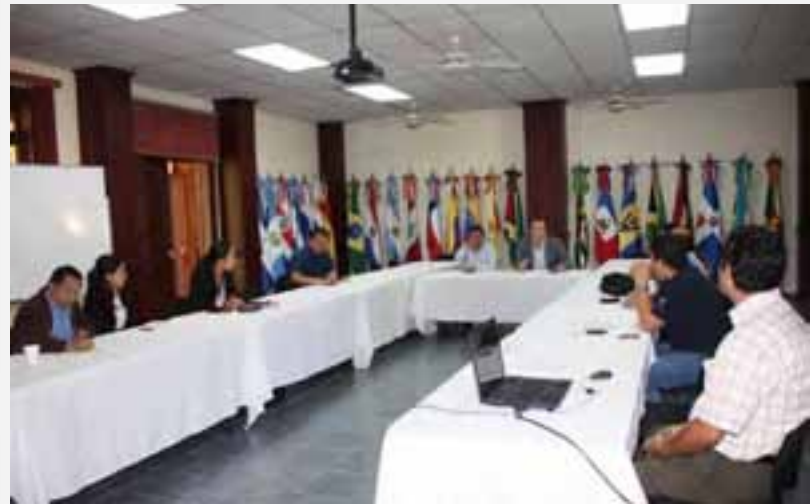
Apicultores salvadoreños en rueda de negocios con empresa danesa Ingemman Food.

Comercialización en Centroamérica. Esta primera acción fue parte de la Gestión de Conocimiento para el Acceso a Mercados, la cual se pretende institucionalizar. La interacción fue un esfuerzo del IICA, CAC y RUTA en el fortalecimiento de las instituciones públicas y privadas para brindar ayuda técnica a productores de pequeña escala en su participación en los mercados locales e internacionales, y en el mejoramiento de su calidad de vida.