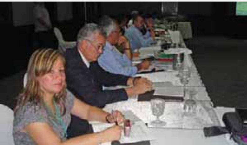
Representante de UNICAES en Taller de Constitución de "Innovagro".

se eligió al Comité Ejecutivo de la Red, por postulación abierta. En el evento también participó la Universidad Católica de El Salvador (UNICAES) entidad que consolidó importantes contactos y conocimiento para su labor académica.