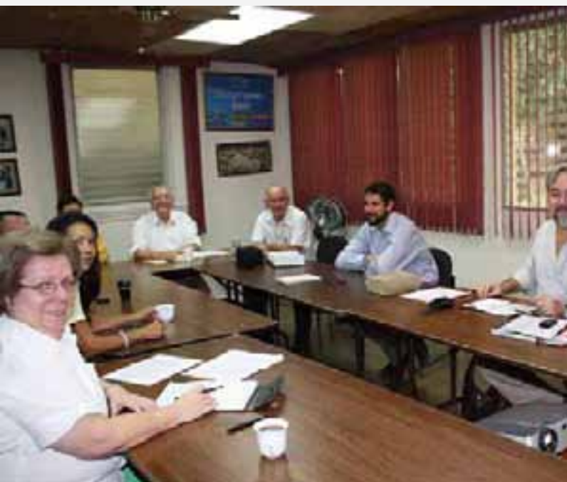
Mesa Técnica de Cacao para Encadenamientos Productivos.

de acuerdos de competitividad con las organizaciones de productores, la disposición de crédito a los productores y el acompañamiento técnico para su real acceso, el impulso a la producción de semillas de calidad para maíz y frijol, la introducción de la agroplasticultura que garantice calidad y productividad, entre otras acciones estratégicas.