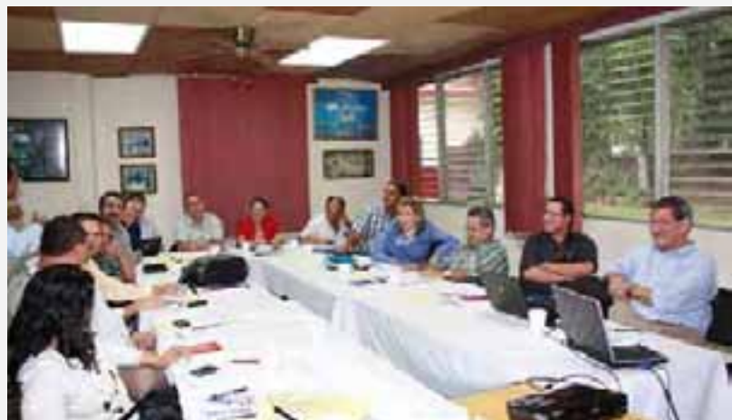
Taller sobre Formulación de Proyectos a Unidad de Proyectos del MAG.

La ruta identificada incluyó una serie de acciones estratégicas claves como la implementación de más de mil Escuelas de Campo (ECAS) y el lanzamiento de un novedoso sistema de extensión agrícola, la constitución del sistema nacional de abastecimiento, la consolidación de mesas de cadenas productivas y la firma