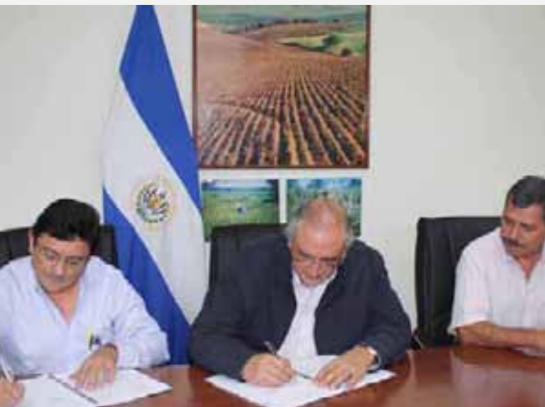
Firma del II Memorando de Entendimiento entre el Gobierno de la República de El Salvador y el IICA para el PAF.

Por otra parte, el Gobierno de la República de El Salvador en el ramo de Agricultura y Ganadería consolidó otro Memorando de Entendimiento con el Instituto Interamericano de Cooperación para la Agricultura, a través de la Representación en El Salvador. El objetivo del acuerdo fue acompañar, integralmente, el proceso de compras de insumos para el óptimo desarrollo del PAF.