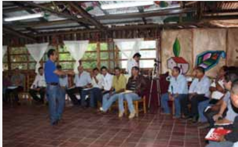
Escuela de Campo con técnicos del Proyecto FOMILENIO.

por US $989,943.43 equivalente al 76.10%. Mediante la actividad de manejo, se generaron 635 (112.30%) empleos de los jornales necesarios para el desarrollo de las actividades en las parcelas. En adopción de tecnología se reportan 1,308 beneficiarios con capacitación en Escuelas de Campo (ECAS) y asistencia técnica que representan un 373.70% de la meta prevista. La contrapartida de inversión de los beneficiarios alcanzó la cantidad de US $1,629,082.00 (306.10%) superando la meta esperada de US $ 532,100 dólares.