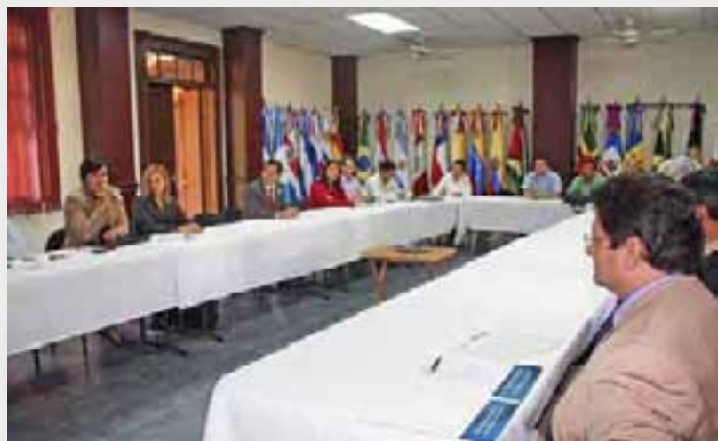
Taller sobre Denominación de Origen para café.

Se firmó el Acuerdo General de Cooperación Técnica con la Universidad Católica de El Salvador, ubicada en el Departamento de Santa Ana en el occidente del país, para consolidar la gestión de la información y el conocimiento entre entidades académicas afines al sector agrícola.