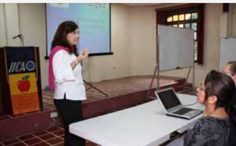
Taller de CONACYT

promotora de un mayor grado de claridad, previsibilidad e información sobre las políticas, normas y reglamentaciones comerciales de todos los Miembros. Nuestra Oficina con el pleno apoyo del programa de SAIA de la Sede Central, durante este año diseñó, implementó y puso en marcha el Sistema de Información en Medidas Sanitarias y Fitosanitarias (MSF) y Codex Alimentarius como apoyo al trabajo técnico desarrollado por los comités nacionales involucrados con este tema. El sistema está instalado y es administrado por el Consejo Nacional de Ciencia y Tecnología (CONACYT), dependencia del Ministerio de Economía, quien funge como autoridad competente y enlace focal ante el Codex Alimentarius; sobre este aspecto, un funcionario de CONACYT fue capacitado durante una semana en la sede del IICA en todos los aspectos relacionados con el uso, aplicación y mantenimiento del sistema.