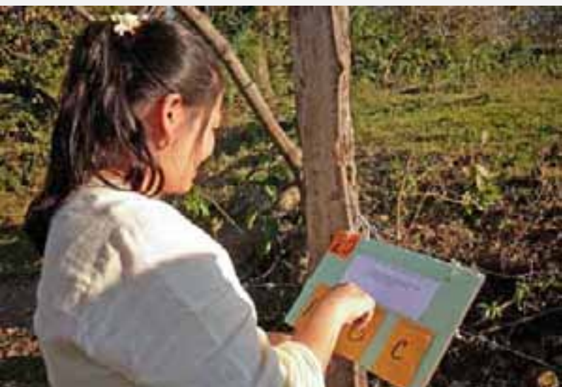
Práctica de campo durante ECA

Adicionalmente, en marzo del presente año, la oficina organizó y desarrolló de manera conjunta, otras dos escuelas de