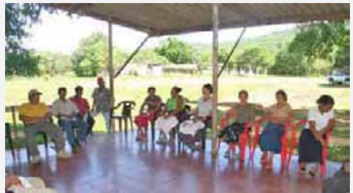
Formulación participativa de proyectos productivos en Departamento de Usulután.

se les capacitó en técnicas de manejo poscosecha y se les dotó de silos metálicos con capacidad de hasta 30 quintales; se les impartió jornadas de capacitación en materia de mecanismos viables de vinculación a mercados formales y se contribuyó con el fortalecimiento de las asociaciones y organizaciones de productores representadas en la alianza del proyecto.