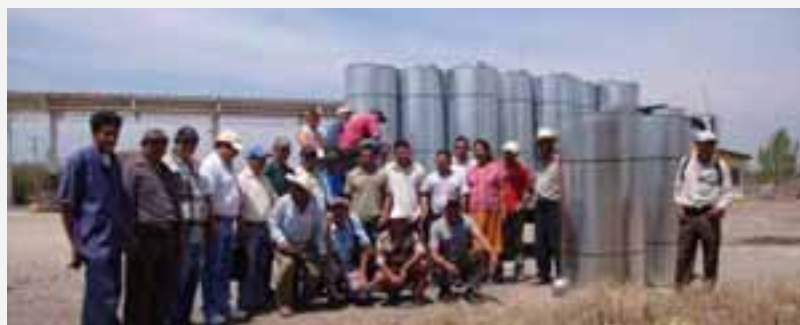
Entrega de silos en el marco de la cooperación IICA-Red SICTA.

Se ha apoyado, técnicamente, la planificación de la Estrategia del Foro de la Zona oriental de Seguridad Alimentaria y Nutricional (FOROSAN), al mismo tiempo se han aportado ideas para la elaboración de la política SAN contribuyendo, de esta manera, al proceso de formación y marco legal de la misma.