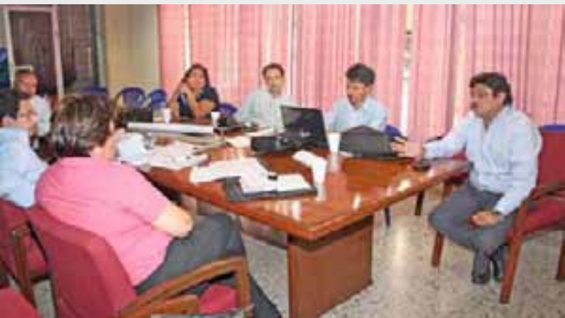
Ejercicio planificación del Plan de Agricultura Familiar entre funcionarios del Ministerio de Agricultura y Ganadería (MAG) e IICA.

En el 2010, el Instituto procuró mejorar la productividad y la competitividad del sector agrícola , a través del fortalecimiento de los sistemas regionales de innovación, tales como el Foro Global de Investigación Agropecuaria y los programas cooperativos de investigación y transferencia de tecnología. Además, como resultado de nuestra cooperación técnica directa, los sistemas e institutos nacionales de innovación de Panamá, Guatemala, Paraguay, Costa Rica y Bolivia tuvieron éxito en fortalecer sus capacidades o redefinir sus acciones.