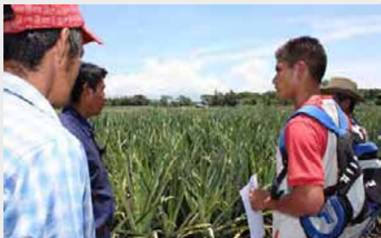
Productores participan en Día de Campo del Proyecto Productivo Hortofrutícola.

Por otra parte, como apoyo al PAF, específicamente, facilitó la vinculación de la agricultura con la industria y el comercio, mediante la organización, preparación y realización de la Rendición de Cuentas bajo un formato innovador, donde se organizó una exhibición que conecta la oferta y demanda; una muestra representativa de las conexiones efectivas entre la producción agrícola y el mercado. Unas 60 instituciones -entre oferentes y demandantes- participando en el evento. Cerca de mil personas asistiendo a la actividad y presenciando el encuentro, donde se originaron importantes intercambios comerciales.