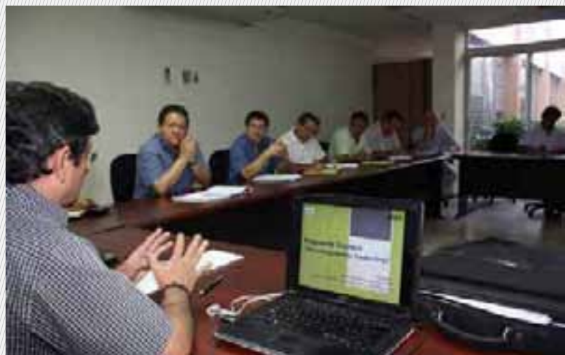
Presentación sobre Encadenamientos Productivos a autoridades y técnicos del Centro de Tecnología Agropecuaria (CENTA).

Es preciso indicar que el PAF consta de cuatro componentes: