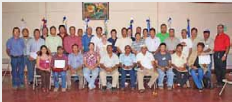
Finalización de la ECA Regional “Capacitación de Capacitadores” realizada entre el Proyecto Mesoamérica e IICA.

campo de agricultores. La primera se llevó a cabo en asocio con el Proyecto Mesoamérica y tuvo como propósito “capacitar a capacitadores” en la metodología de ECAS-. Estuvo dirigida a un grupo de 28 profesionales vinculados al desarrollo de la fruticultura en la región mesoamericanana (México, Centroamérica, así como Colombia y República Dominicana). Y la segunda, contribuyó