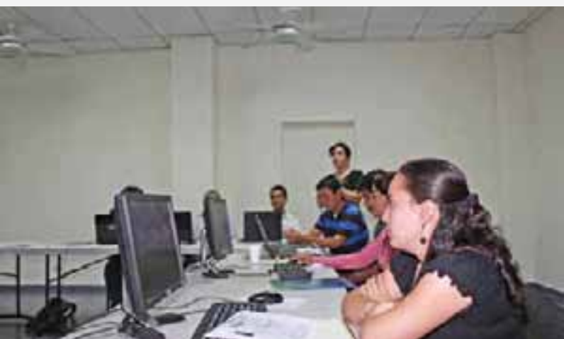
Taller sobre Sistemas de Información en el Centro de Liderazgo y Capacitación

Se constituyó el Centro de Liderazgo y Capacitación de la Oficina, equipado con tecnología moderna de video, audio y comunicación; se impartieron más de 10 videoconferencias en diversas áreas como: denominación de origen, sanidad e inocuidad, innovación, pobreza rural, experiencias de vinculación a mercados, entre otras. En 9 meses de funcionamiento, el Centro celebró más de 30 eventos de capacitación con distintos públicos beneficiarios.