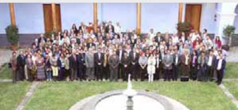
I Semana del Desarrollo Rural Territorial de Centro América y República Dominicana

Siempre dentro del marco de la ECADERT, se ha contribuido al diseño del Curso Centroamericano en Gestión del Desarrollo Rural Territorial, el cual beneficiará a técnicos de instancias de gobierno involucrados en el Desarrollo Rural Territorial y a los diferentes actores territoriales. La experiencia territorial de la Zona Alta de Chalatenango se ha convertido en un referente para las organizaciones involucradas en el Desarrollo Rural, tanto a nivel nacional como regional. De manera especial, se han planteado y puesto en marcha nuevos emprendimientos empresariales para los jóvenes en esa iniciativa.