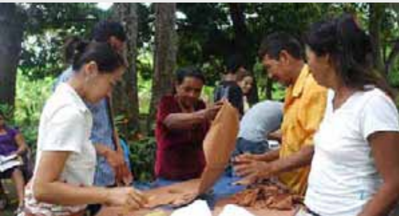
Taller de teñido con hojas de mangle en el oriente del país.

Durante el último trimestre del 2010, se capacitó a un grupo aproximado de 20 jóvenes (mujeres y hombres) de la Asociación el Mangle, conformado por pequeños pescadores ubicados en la zona oriental del país, en la elaboración de fibras y confección de tejidos, a partir