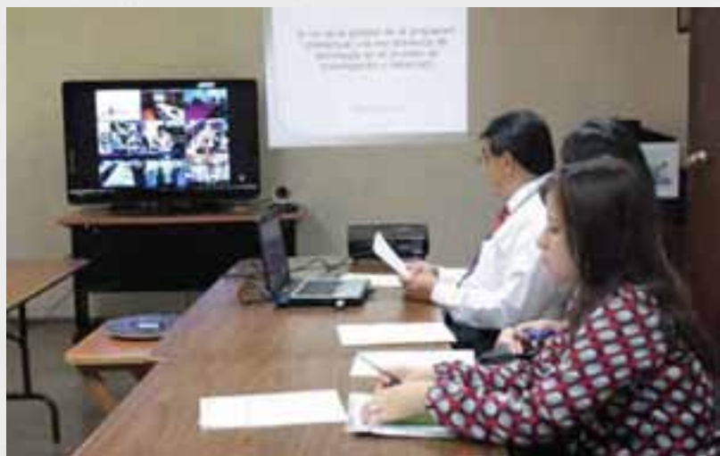
Videoconferencia sobre Propiedad Intelectual del Programa de SAIA del IICA y la Universidad de Nebraska.

Por otra parte y dado que en el contexto de la Organización Mundial de Comercio (OMC), la transparencia representa uno de los principios fundamentales de sus Acuerdos; concebida ella como la