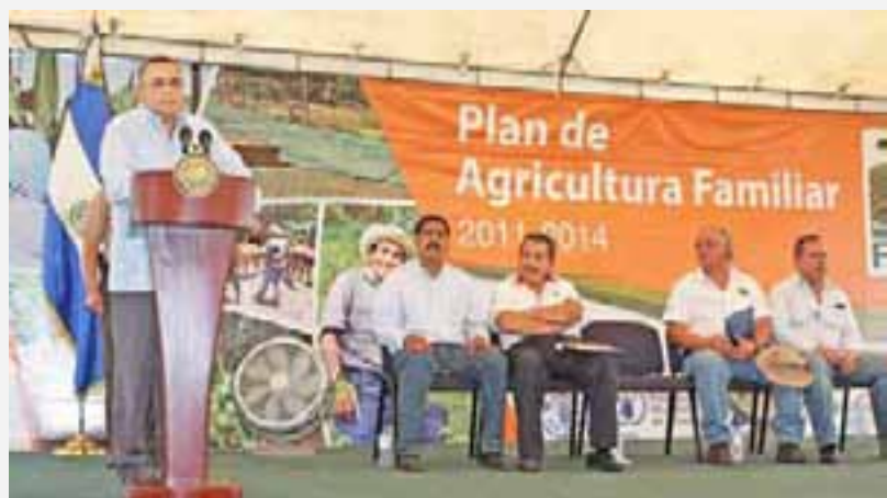
Presidente de la República, Mauricio Funes, lanzó el Plan de Agricultura Familiar en San Vicente, El Salvador. Febrero 2011

En 26 países, incluido El Salvador, el IICA brindó apoyo dirigido a modernizar sus servicios veterinarios, fitosanitarios y de inocuidad de los alimentos, el cual les permitió mejorar sus capacidades en el manejo de las medidas fito y zoonositarias e identificar áreas comunes para resolver problemas en materia sanitaria. Asimismo, con la cooperación del IICA y la ayuda financiera del Fondo para la Aplicación de Normas y el Fomento del Comercio de la Organización Mundial del Comercio (OMC), 24 países lograron proponer y aprobar normas para el beneficio de su comercio en las instancias de diálogo multilateral, como son los Comités del Codex Alimentarius y el Comité de Medidas Sanitarias y Fitosanitarias (CMSF) de la OMC. Por otra parte, el Instituto desarrolló manuales metodológicos para la notificación de medidas sanitarias, sistemas de información y perfiles de riesgos fitosanitarios, los cuales son de gran utilidad para que los Estados Miembros continúen fortaleciendo sus capacidades para hacer frente a los acuerdos comerciales.