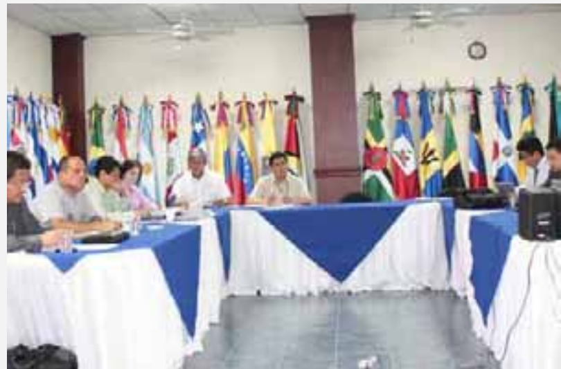
Instituciones salvadoreñas interesadas en la Red Latinoamericana de Gestión para la Innovación.

Se impulsó la constitución de la Red Latinoamericana de Gestión para la Innovación mediante la conformación de diez instituciones salvadoreñas dispuestas a participar en la iniciativa, con el objetivo de enfocarse en los productores y su demanda existente de innovación a fin de atender los problemas relacionados con la ausencia de este importante factor en el sector agrícola, y fortalecer las capacidades nacionales. En el taller de conformación de la Red en Guadalajara, Jalisco, México,