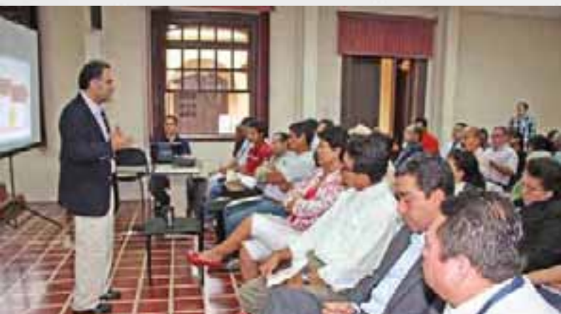
Capacitación para vincular pequeños productores agropecuarios a los mercados.

Se inauguró, en mayo 2011, la Primera Videoconferencia, del Ciclo 2011, con el tema: Propuesta Estratégica de la Iniciativa y Experiencias Innovadoras de