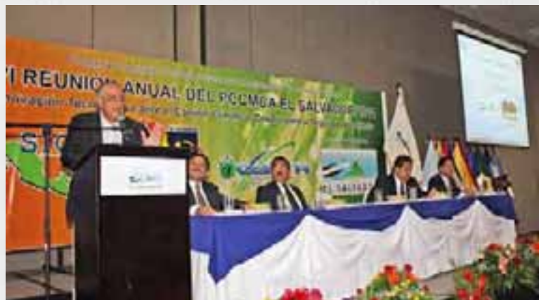
Inauguración del PCCMCA, en el departamento de Sonsonate.

En esta oportunidad, el lema del evento fue “Innovación Tecnológica ante el Cambio Climático: Desafío para la Seguridad Alimentaria” el evento fue organizado por el Ministerio de Agricultura y Ganadería (MAG), a través del Centro Nacional de Tecnología Agropecuaria y Forestal “Enrique Álvarez Córdova” (CENTA), del 25 al 29 de abril de 2011. El país ganó con las diversas actualizaciones tecnológicas de las