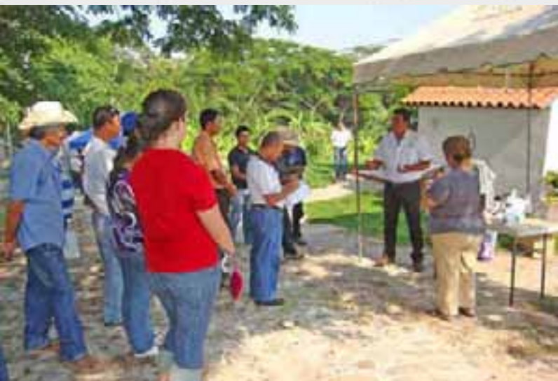
Gira de aprendizaje en campo en la zona baja del departamento de Chalatenango.

Al 15 de mayo de 2011, se han atendido a 1,533 beneficiarios que representan el 109.50% de la meta establecida, con una cobertura de 926.3 hectáreas atendidas. La meta de producción alcanza un 40.40% debido a que se han contabilizaron 2,248.02 Tm producidas, lo cual ha generado ventas acumuladas