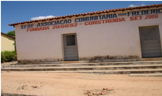
Assentamento 10 de Abri