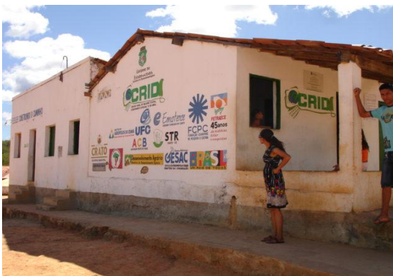
Sítio Rostos e Adjacências