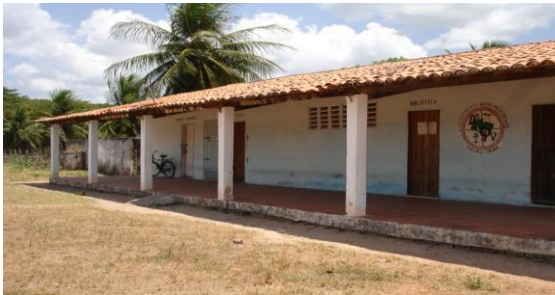
Comunidade de Morrinhos

Núcleo de Estudos Agrários e Desenvolvimento Rural