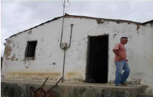
Sítio Malhada - CE