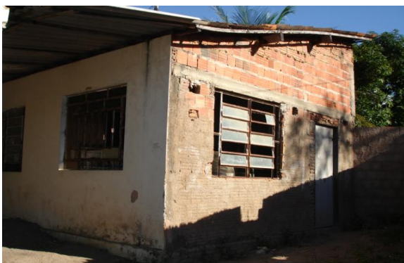
Assentamento Nova Vida