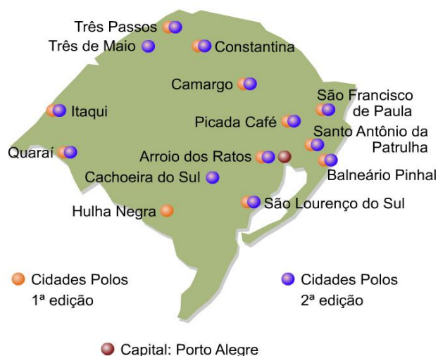
Figura 1: Municípios/polos em que o curso foi oferecido na primeira e segunda edição.

Abaixo apresenta-se uma figura com a distribuição dos municípios/polos no Rio Grande do Sul.